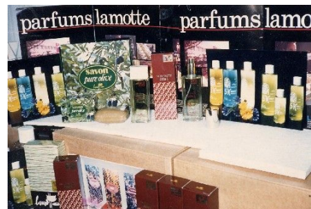
＜ラモット社製品展示風景＞

“ラモット”創始者が、見守る“lamotte”ブランド・ブランドの充実に御協力を宜しくお願い申し上げます。