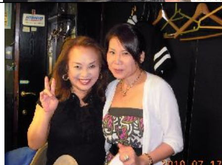
洋子ママの、サービスで楽しく！