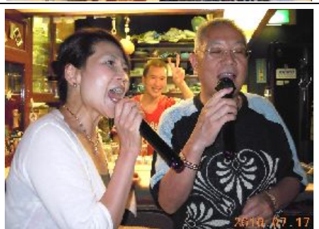
マスターの手料理で、美味しく御馳走様！