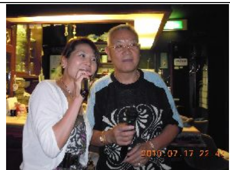
会話の盛り上がりを見せる中でデュエット！