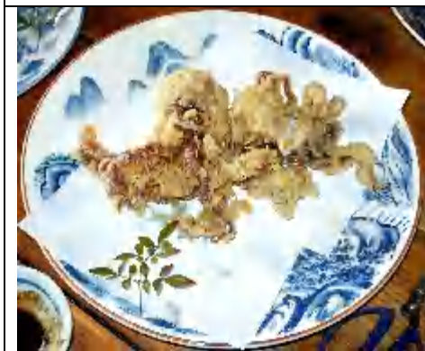
手長たこ・丸揚げ