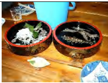
左:手長たこ・活刺 / 右:活えび