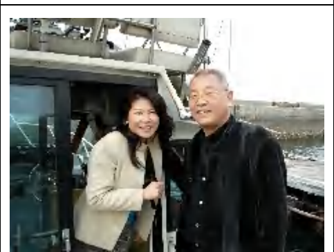
お腹一杯で、いざ出航！

これら写真以外にも、黒鯛(1匹) 塩焼・かれい(3匹)から揚げや具 沢山・味噌汁など、食べ切れない 美味なる海の幸が登場するの です。