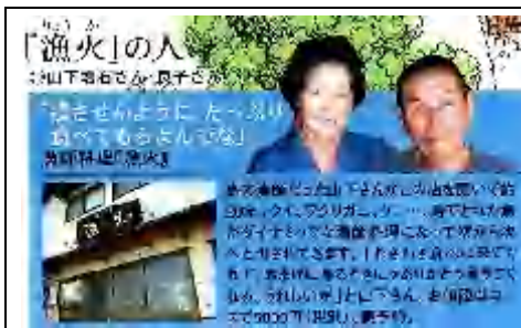
「魚火」 出てきた料理を、御覧下さい！