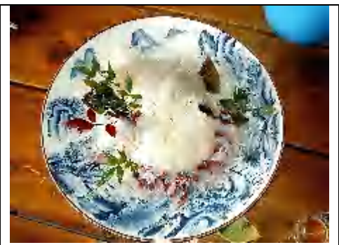
ひらめ・カワハギ・黒鯛