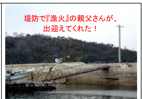
堤防で『漁火』の親父さんが、出迎えてくれた！