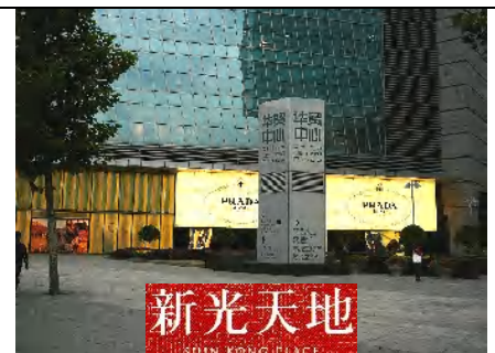
新光天地 SHIN KONG PLACE 三越と提携の大型店(北京)

日本なら発車間際にバタバタと乗車してくるのですが、発車の20分前には殆どの席に乗客が座っています。改札と同時に指定席であるのに我先に急ぎ足で乗車するのですが、どうなっているのでしょうか?