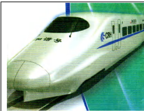
和谐号 CRH 2 型动车组 ＜8両編成＞