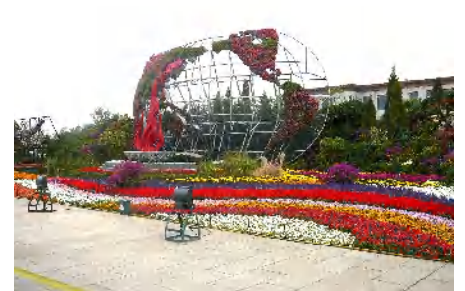
上の3枚は、天安門に向って右側に並ぶオリンピックのモメントです。