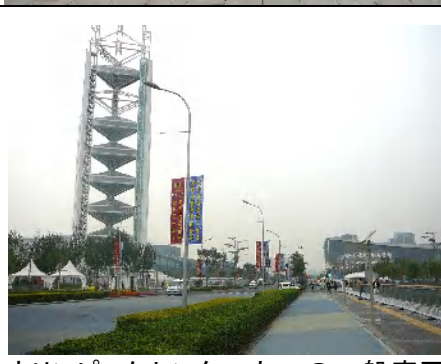
オリンピックセンター内への一般車両は進入禁止状態でした。展望タワー