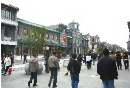
前門通り旧街並みを再現しただけで営業している店舗は極僅かで内装も工事途中のところが多く在ります。