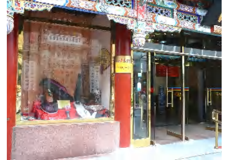
横筋商店街の靴店ショーウィンドー昔の靴作りを再現してありました。写真撮影用に店頭モメントが多い！