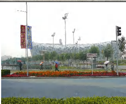
小雨が降る“鳥の巣”は、上斜め方向から見るのが良いかも？