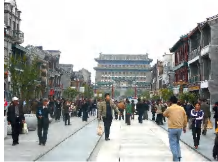
路面電車用の線路は復元しただけで電車が走る気配は全くありません。正面奥が、前門です！